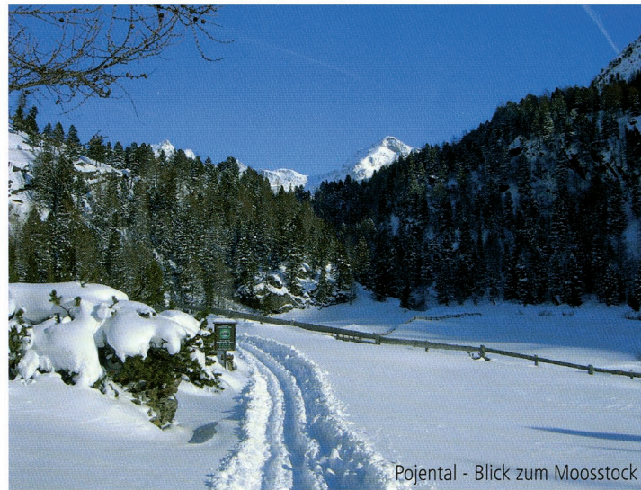
Pojental - Blick zum Moosstock