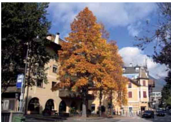
Ein Baum, der bereits frühzeitig in der Planung vorgesehen wurde, hat zumeist auch den benötigten Raum und die Zeit zu wachsen und sich zu entfalten.

Daneben erfüllt das Siedlungsgrün umwelthygienische Aufgaben und übt einen positiven Einfluss auf das Mikroklima aus. Entlang von Grünzügen erfolgt die Durchlüftung unserer Siedlungen, die verschmutzte Luft der Zentren wird durch saubere Luft der Umgebung ersetzt. Staub und Luftschadstoffe werden von der Bepflanzung ausgefiltert und über die Niederschläge oder den herbstlichen Blattfall in den Boden abgeführt. Pflanzen spenden Schatten und verhindern somit das Aufheizen von Straßen- und Fassadenflächen, zudem halten Grünanlagen Niederschläge zurück und sorgen mittels der Transpiration besonders in den warmen Monaten für eine Abkühlung und Befeuchtung der Luft.