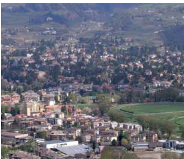
Das Meraner Stadtgebiet ist bekannt für seinen üppigen Baumbestand. Besonders im Villenviertel von Obermais dominieren private Gärten und Parkanlagen das Erscheinungsbild der Stadt, die Bebauung tritt hinter die Baumstruktur zurück.

Neben der Gemeindebauordnung könnte es Aufgabe der Durchführungspläne (z.T. auch der Bauleitpläne) sein, Kriterien für die Begrünung zu erstellen: Mindestmaße für Grünflächen und die Anzahl von Bäumen je Einheit könnten die Grundausstattung für die Siedlung gewähren. Doch beinhalten die gelieferten Gestaltungspläne kaum konkrete Angaben zur Bepflanzung der Grundstücke und so geht deren Information selten über die Anordnung der Baulichkeiten und Nutzflächen im Gelände hinaus. Eine Ursache dieses Missstandes liegt sicherlich auch in der Praxis, dass die Durchführungspläne im Allgemeinen von Architekten und anderen Technikern erstellt werden. Zumeist sind diese wohl fachlich nicht so bewandert, wenn es um die Gestaltung der Außenflächen geht und nur die allerwenigsten Planer dürften mit den Pflanzen soweit vertraut sein, um diese gezielt im Siedlungsraum einzusetzen. Eine diesbezügliche Zusammenarbeit mit Landschaftsarchitekten und Grünraumplanern kam bisher nur in seltenen Fällen zustande, wäre jedoch vielfach wünschenswert, um die Qualität der Siedlungen zu verbessern.