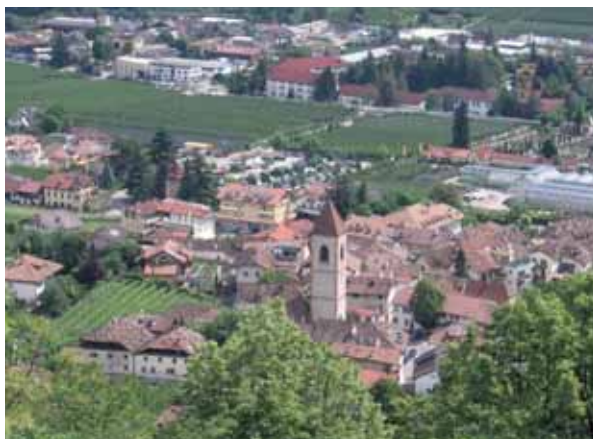
Im Randbereich der Ortschaften dehnen sich neue Wohnbauzonen und Gewerbegebiete aus. Sie übertreffen die alten Siedlungskerne um ein Vielfaches.

Niemals zuvor wurde in Südtirol so viel gebaut wie in den letzten Jahrzehnten. Bei knapp steigender Bevölkerungszahl wachsen Städte und Dörfer, entstehen immer neue Wohnbauzonen und Gewerbegebiete und bedecken zunehmend größere Teile unserer Landschaft. Neue Materialien und moderne Formen nehmen oft wenig Rücksicht auf das Umfeld und drücken den Siedlungen ihren Stempel auf. Im Sinne einer optimierten Wertschöpfung werden die urbanistischen Parameter bis an ihr Limit ausgenutzt und das maximale Bauvolumen errichtet. Daneben wird noch Garagen und Parkplätzen ein hoher Wert eingeräumt, auch Erschließungen und Infrastrukturen beanspruchen ihren Raum. Was dann noch übrig bleibt, darf begrünt werden. Dabei ist gerade dieses Grün in hohem Maße für die Qualität der Siedlungen ausschlaggebend und entscheidet über das Wohlbefinden der Bewohner und Nutzer. Neben ökologischen Aspekten hat die Bepflanzung einen positiven Einfluss auf das Mikroklima und bietet den Menschen Räume zur Erholung und für die Entspannung. Darüber hinaus schaffen Grünräume Verbindungen und besitzen schlussendlich auch eine psychologische Funktion, da sie das Ortsbild formen und beleben und ihm somit seine eigene Identität verleihen.