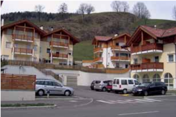
Das Bild unserer Siedlungen wird dominiert von den Gebäuden und konstruktiven Elementen. Die fehlende Grünplanung lässt sich im Nachhinein nicht mehr einbringen.

Die Entwicklung der Siedlungsgebiete wird primär durch die Raumordnung geregelt. Im Landesgesetz vom 11. August 1997 Nr. 13 – „ Landesraumordnungsgesetz “ (in aktueller Fassung) und den zugehörigen Durchführungsbestimmungen werden die Weichen für die Ausweisung und Inhalte von Wohnbauzonen und Gewerbegebieten, Zonen für öffentliche Einrichtungen u.s.f. gestellt. Aufbauend auf das Gesetz arbeiten die Gemeinden Bauleitpläne aus, in denen die Zonen lagemäßig festgehalten sind und die Bebauungsdichte definiert wird, Durchführungspläne regeln die Abstände und Höhen der Baukörper, Bau- und Verkehrsflächen, Infrastrukturen etc. innerhalb der Zonen. Für die Begrünung in den Siedlungen gibt es hingegen lediglich einige quantitative Parameter wie beispielsweise über die Ausmaße von Kinderspielplätzen, während qualitative Kriterien vollkommen fehlen.