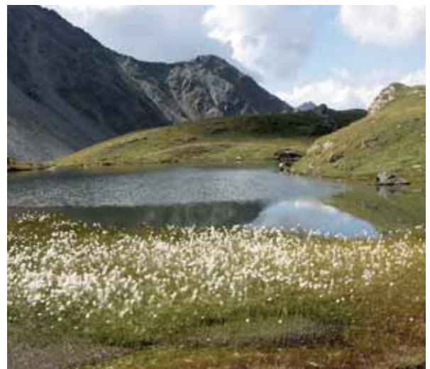
Napfenlacke - Rein in Taufers

Feuchtflächen, insbesondere Moore, sind Standorte vieler seltener und vom Aussterben bedrohter Pflanzenarten, die an extreme ökologische Bedingungen (Nährstoffarmut, Dauernässe) angepasst sind. Wenn der Untergrund aus Torf besteht, spricht man von Mooren, welche dank ihres hohen Wasserspeichervermögens vor Hochwasser schützen und andererseits die Quellen in Trockenzeiten nicht versiegen lassen. Feuchtflächen sind äußerst empfindlich gegen Trittbelastung und Anreicherung von Nährstoffen durch das Vieh. Die Beweidung, die für das Vieh überdies kaum verwertbares Futter bringt, bedingt eine starke Störung bzw. Zerstörung der Vegetation. Seltene Feuchtpflanzen verschwinden, Gewässer - insbesondere von Mooren gespeiste Quellen und Tümpel - werden verunreinigt.