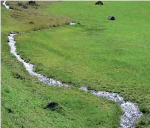
Wiesenbachl – Versell-Alm Gsies

Zum Großteil sind sie verschwunden, aber hie und da gibt es sie doch noch, die Wiesenbäche. Zumeist sind es nur kleine wasserführende Gräben , welche sich mit einem sanften Murmeln durch die Felder schlängeln, doch sie haben einen großen landschaftlichen und ökologischen Wert. An ihren Rändern wachsen meist besondere Pflanzen und Sträucher und sie sind Lebensraum für viele Tiere.