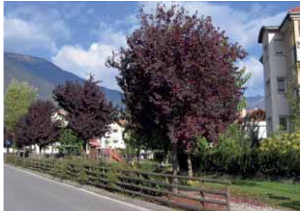
Während auf den Straßen die Verkehrsteilnehmer in ihren Fahrzeugen abgeschottet sind und ein Kontakt durch hohe Geschwindigkeiten und Lärm unmöglich ist, bieten Grünflächen Platz für die Begegnung von Menschen und erfüllen somit auch eine wichtige soziale Funktion.

Streuobstwiese werden zwischen den Baukörpern in die Siedlung hineingezogen, bestehende Gewässer und Gehölzstreifen sind mit Rad- und Fußwegen flankiert, wodurch menschenfreundliche Verbindungen zu anderen Ortsteilen entstehen. Bei den meisten Beispielen werden die Autos aus der Siedlung ausgesperrt und in Garagen oder an Sammelparkplätzen konzentriert; bei lockerer Verbauung wird die Anlage von Wohnstraßen vorgeschlagen. Daneben trägt das Grün natürlich stark zur Gestaltung der Straßenräume bei, durch die Verwendung einer einheitlichen Baumbepflanzung erhalten Siedlungen eine eigene Identität und unterscheiden sich vom Nachbarviertel, wodurch auch die Orientierung in der Stadt verbessert wird.