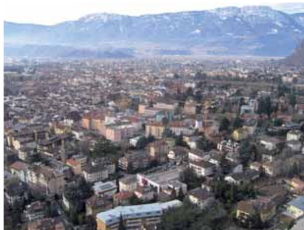
Besonders in den großen Ortschaften ist jeder unverbaute Flecken und jede unversiegelte Fläche bedeutend für die Lebensqualität.

Auch in Bozen hat man sich Gedanken gemacht, wie das kostbare Grün in den städtischen Raum integriert werden kann. Das Ergebnis dieser Überlegungen ist der Beschränkungsindex der versiegelten Flächen – B.V.F. (ital. R.I.E.), der die Qualität des baulichen Eingriffs mit der Durchlässigkeit des Bodens und den Grünflächen in Verhältnis setzt. In der praktischen Umsetzung gibt das Verfahren einen numerischen Richtwert für die Versiegelung der Flächen, der vom Projekt eingehalten werden muss. Entsprechend der Nutzung der Siedlungsfläche ist ein unterschiedlicher Wert anzupfeilen, der beispielsweise in Wohnzonen deutlich höher liegt als in Gewerbegebieten. Entscheidend ist