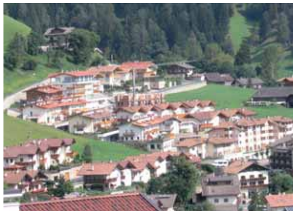
Während alte Siedlungsbereiche häufig eine passable Begrünung auch mit hochstämmigen Baumpflanzungen aufweisen, ist in den neuen stark bebauten Wohnbauzonen eine nachträgliche Aufwertung der Grünstrukturen oft kaum möglich.

Diese Ausdehnung der Siedlungen geht zwangsweise zu Lasten der freien Landschaft . Zunehmende Bebauung und Versiegelung erhöhen und beschleunigen den Oberflächenabfluss und wirken sich negativ auf das Mikroklima aus. Durch die größeren Siedlungen steigen die Distanzen, welche die Menschen zurücklegen, um ihren Alltag zu organisieren; in der Folge steigt das Verkehrsaufkommen und belastet Wohn- und Arbeitsumfeld. Um diesen negativen Entwicklungen entgegen zu wirken, ist es dringend notwendig einen Teil der Landschaft, die wir geopfert haben, wieder in die Siedlungen einzubringen, als Gärten und Parkanlagen, Alleen, Einzelbäume oder Gehölzgruppen.