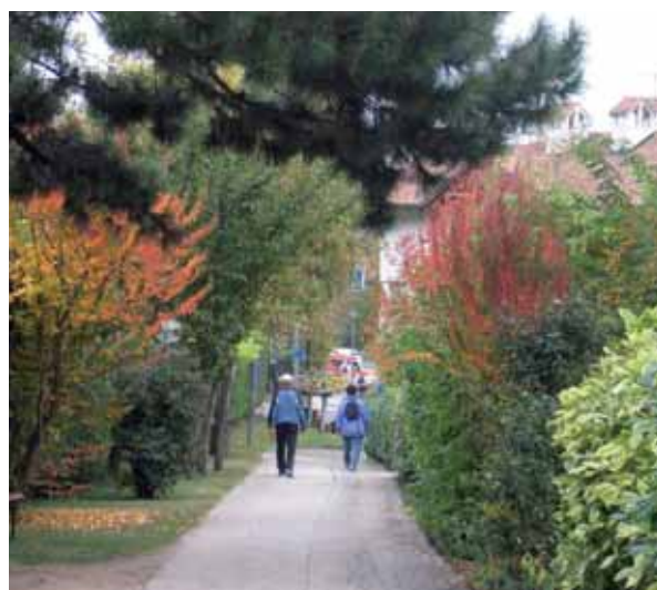
Grünzüge bilden nicht nur Frischluftschneisen zur Auflockerung und Durchlüftung der Ortschaften, sondern stellen auch menschenfreundliche Verbindungen im Siedlungsgebiet dar.

Im benachbarten Ausland bildet der Grünordnungsplan einen allgemein anerkannten Bestandteil jeder Siedlungserweiterung bzw. bei Erneuerungen im bebauten Gebiet. Als urbanistisches Instrument dient er dazu, die Entwicklung der Grünstruktur im Siedlungsraum zu definieren. Dabei wird selbstverständlich auch dem Baum- und Freiflächenbestand im Planungsgebiet die zustehende Aufmerksamkeit erteilt, daneben fließen noch ökologische Kriterien in die Planung ein. Es werden sowohl öffentliche als auch private Flächen in die Betrachtung mit einbezogen, da nur ihr Zusammenwirken schlussendlich zu einer lebenswerten Umgebung führen kann. Ziel ist selbstverständlich die Erhöhung der Lebensqualität in den Siedlungsbereichen.