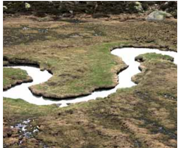
Wieser Werfa - Mäander - Prettau

Die von Seggen und Sauergräsern dominierten Feuchtwiesen beherbergen eine reiche Insektenfauna sowie eine bunte, gefährdete Begleitflora. Sie sind durch Entwässerungen sowie Intensivierung durch Düngung und frühe Mahd gefährdet. Häufig bilden sie wichtige „Pufferzonen“ zwischen nährstoffarmen Feuchtgebieten und intensiv bewirtschaftetem Grünland. Die extensive Bewirtschaftung soll hingegen zur Erhaltung der typischen Feuchtvegetation und zur Verhinderung des Nährstoffeintrages in Grund- und Oberflächengewässer beitragen.