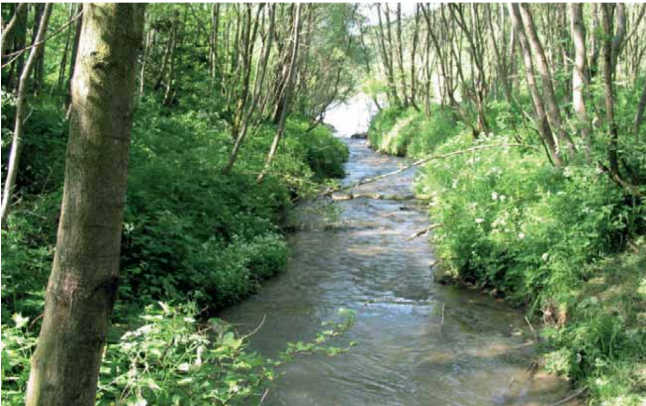
Auwald – Ahrauen Gais

Der Waal ist ein vom Menschen angelegter Bewässerungskanal oder Graben , der das Wasser meist von einem Bach zu den oft sehr weit entfernten